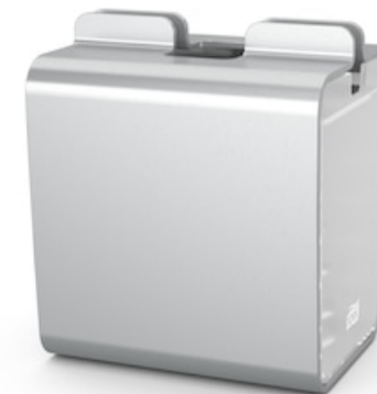
Tork XPN Dist. pour serv. enchev. Alu N4 274002