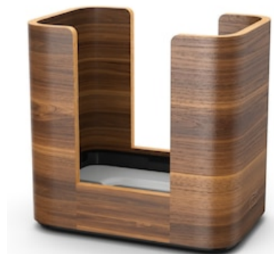
Tork XPN Dist. pour serv. enche. Bois N4 273002