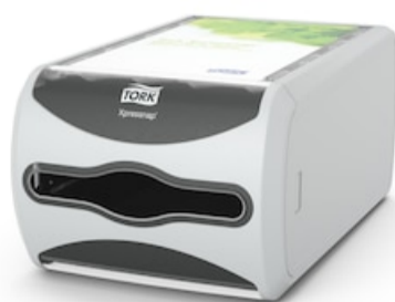
Tork XPN Distrib Sv Comptoir, Gris (N4) 272513