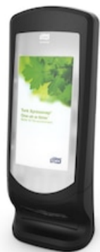
Tork XPN Distrib Sv Gde Capa, Noir (N4) 272211